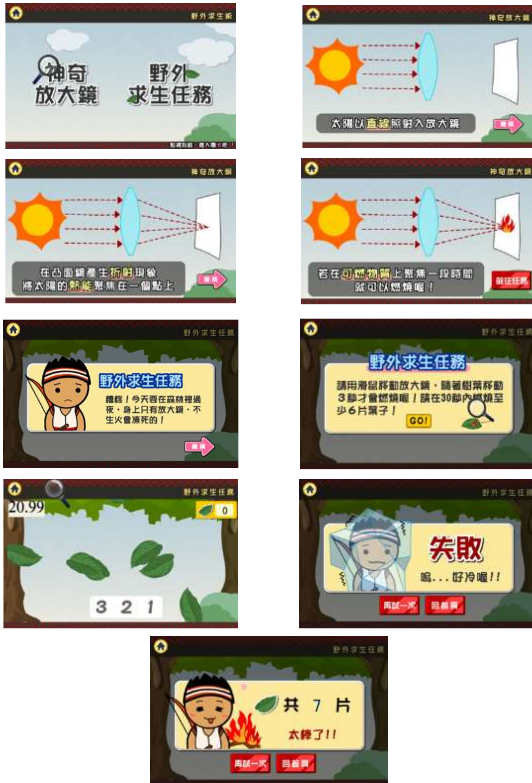
圖 3、「認識太陽能」課程中一個互動式教材畫面截圖