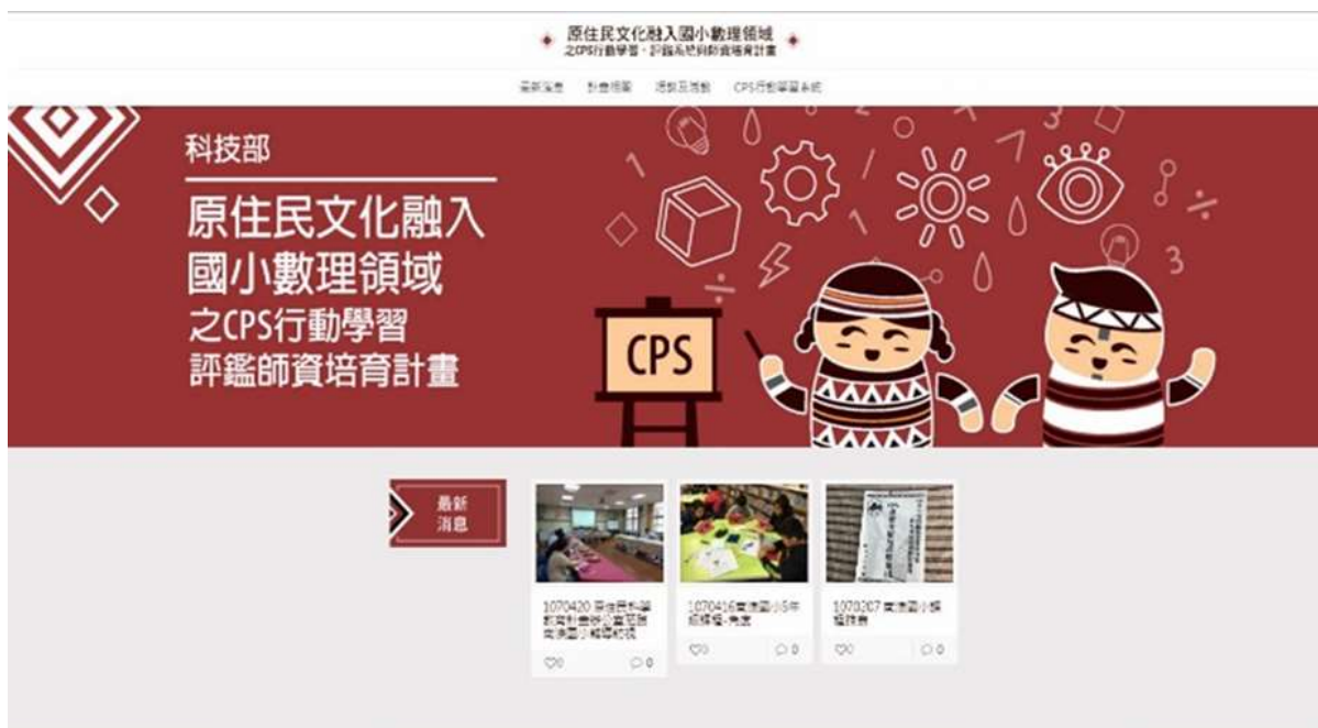
圖 4、CPS 行動學習平台

圖4為目前總計畫建置之CPS行動學習平台(網址: http://cpslearn.ntue.edu.tw/ )，此平台將彙整所有子計畫發展的成果，包含：CPS行動學習課程、評量系統(含PISA題組)、APP遊戲、教學資源、師資培育、學習歷程和計畫資訊等。