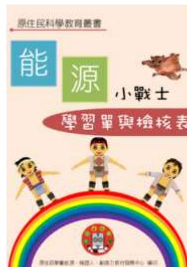
圖 1(b)、能源教材系列叢書：教學指引、學習單與檢核表（資料來源:本研究）

在參與第一期的原住民科學教育計畫後，有以下三點檢討與展望，簡述如下。(一) 課程應「數位化」以擴大影響效應：將課程內容數位化，全臺皆可透過網際網路輕易分享本計畫之研究成果，於推廣上更為有效應；(二) 課程設計應朝向「內建式」：第一期開發之課程為「外掛式」會加重學童課業上的負擔，但若為以原住民文化為本位的「內建式」課程，配合教師授課時使用，可讓原住民學童能減輕課業上的負擔，並能獲得最大效益；(三) 課程評量應朝向「多元評量」：除了傳統的紙筆測驗外，還可考量原住民學童的學型特性進行評量，如使用數位式互動問答的測驗方式。