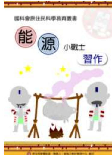
圖 1(a)、能源教材系列叢書：課本、習作（資料來源:本研究）