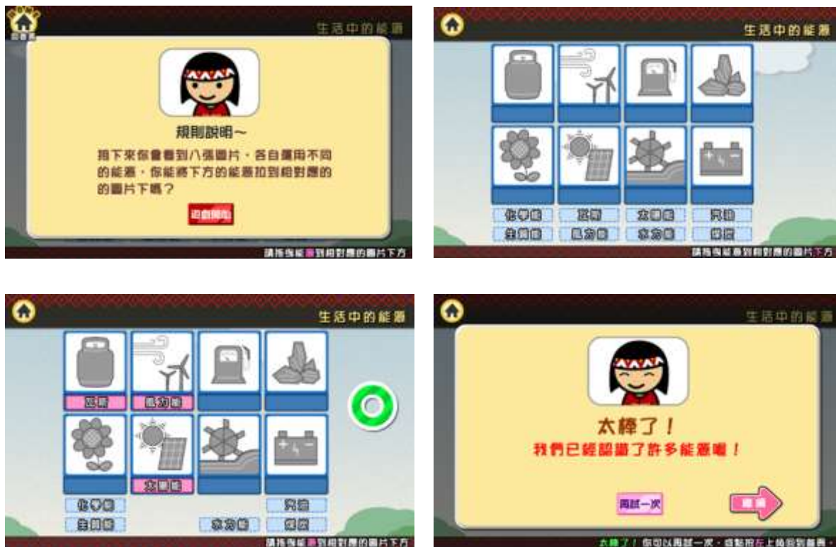
圖 5、「能源概論」單元中的一個 APP 遊戲（資料來源:本研究）

本子計畫二開發的是國小自然與生活科技領域中與能源、機器人相關的APP遊戲，圖5顯示「能源概論」單元中的一個APP遊戲。此APP遊戲以生活中的能源為例，透過圖片與文字的配對，認識能源與其應用的連結，教師可在進行活動時加以說明各種能源在日常生活中的使用。而在配對成功後會給予回饋，配對結束後可選擇再玩一次或是依據劇情繼續闖關。