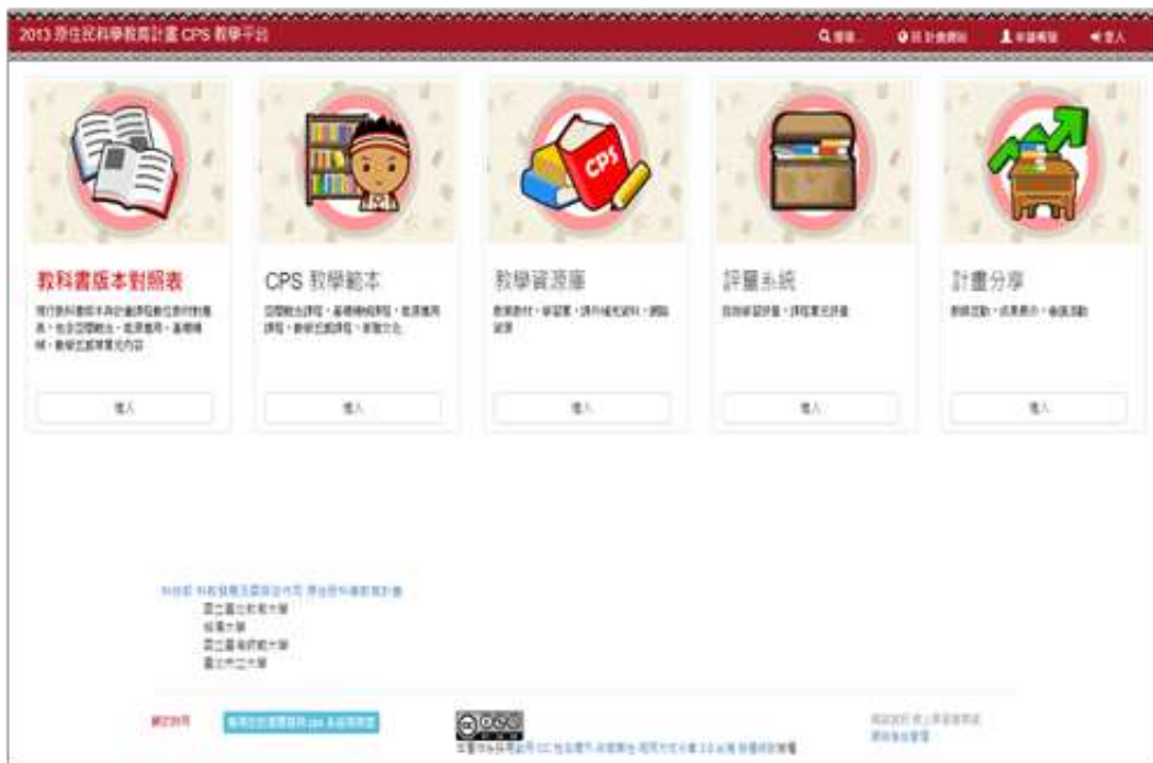
圖 2、CPS 數位教學平台